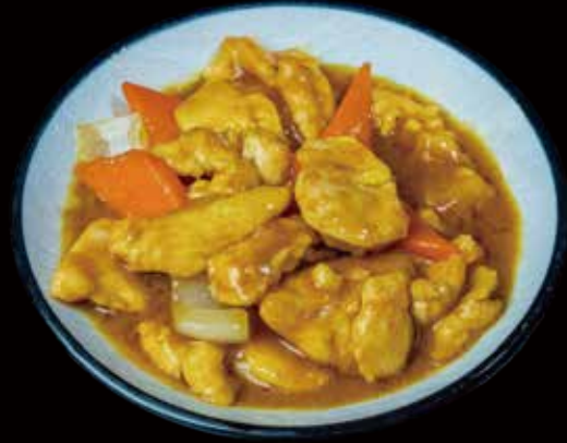
51 POLLO AL CURRY curry chicken