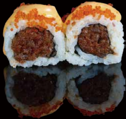
315 URA ATÚN PICANTE 4u spicy tuna ura roll 4p