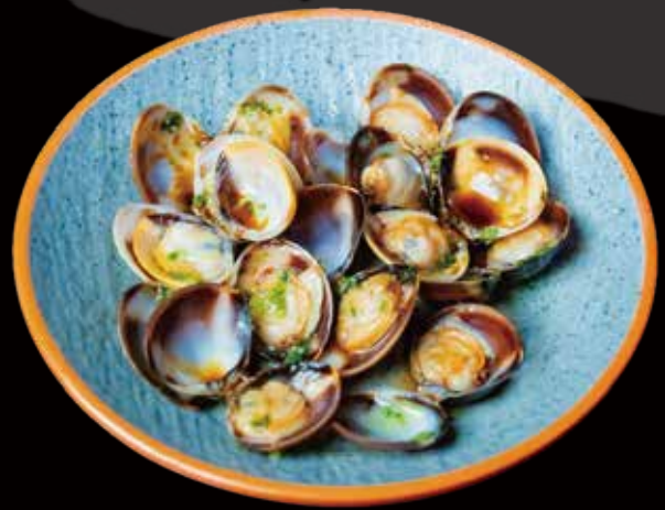
79 ALMEJAS A LA PLANCHA grilled clams