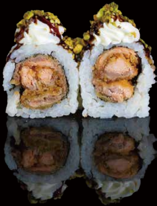
305 URA SALMÓN FRITO CON PHILADELPHIA 4u fried ura salmon with philadelphia 4p