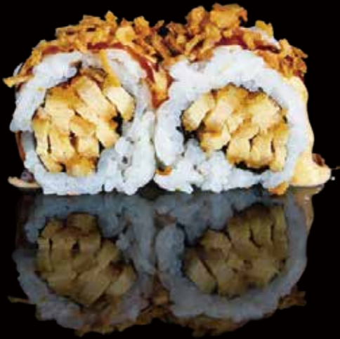
307 URA POLLO FRITO 4u fried chicken ura 4p