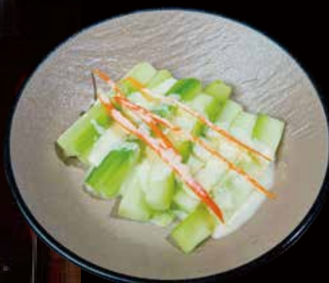
5 ENSALADA DE PEPINO cucumber salad