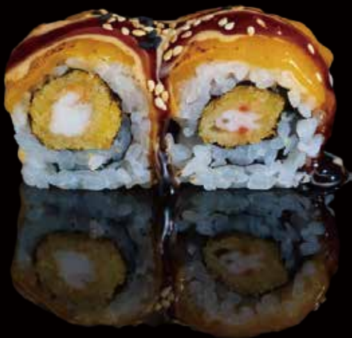
316 URA ESPECIAL DE GAMBAS CON CHEDDAR 4u special shrimp ura with cheddar 4p