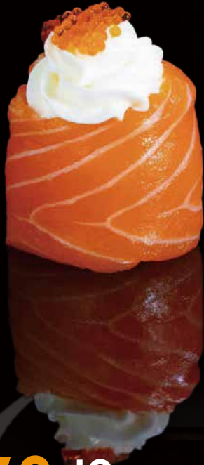
259 JO FLOR 1u flower jo 1p