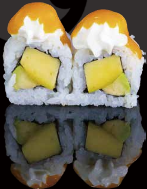
308 URA MANGO CON AGUACATE 4u ura mango with avocado 4p