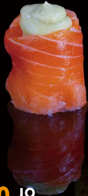
260 JO AGUACATE 1u avocado jo 1p