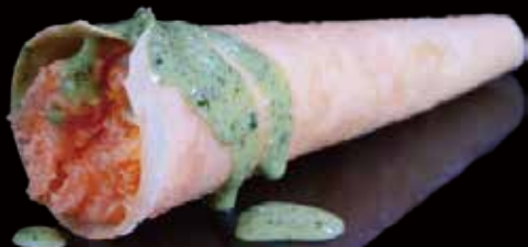
206 CONO DE SAKE 1u salmon cone 1p