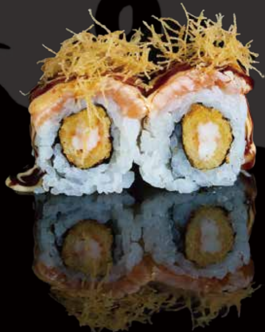
317 URA ESPECIAL DE GAMBAS CON KATAIFI 4u special shrimp ura with kataifi 4p