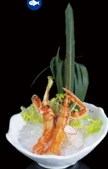
356 SASHIMI CIGALAS 2u scampi 2p 2.00€