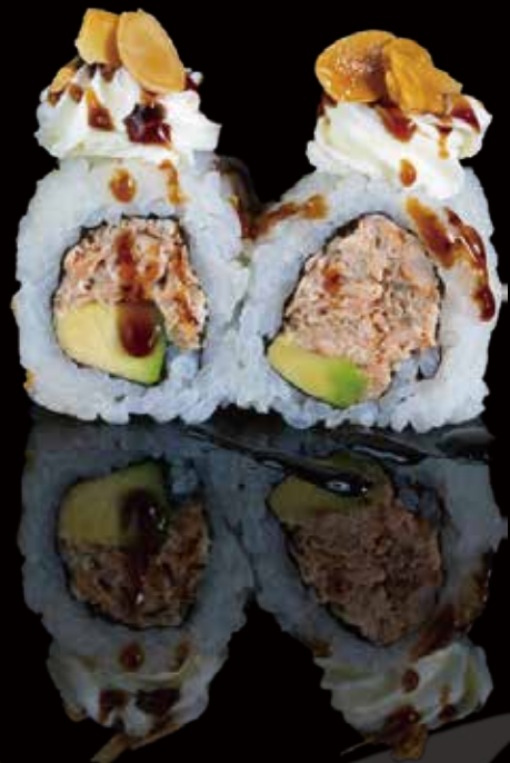
306 URA SALMÓN COCIDO 4u Cooked Ura Salmon 4p