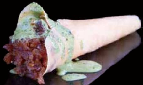
207 CONO DE ATÚN 1u tuna cone 1p