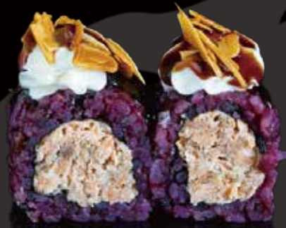
331 URA BLACK SALMÓN COCIDO 4u black cooked salmon ura 4p