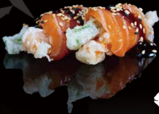
210 ROLLITO DE SAKE CON PEPINO Y MANGO 2u salmon roll with cucumber and mango 2p