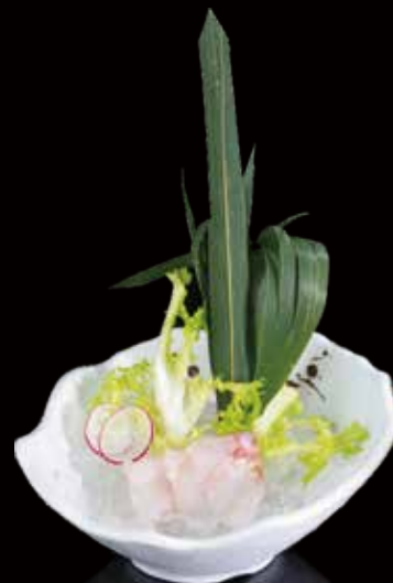
352 SASHIMI SUZUKI 3u sea bass (suzuki) sashimi 3p